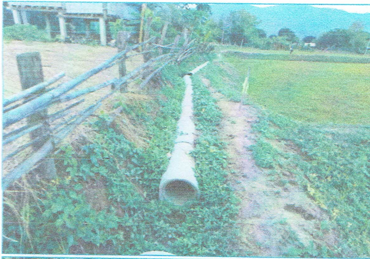
รูปภาพการก่อสร้างแล้วเสร็จ

โครงการจัดซื้อวัสดุก่อสร้างท่อระบายน้ำ คสล. โดยใช้แรงงานราษฎรเป็นหลัก บ้านสมัยเหนือ หมู่ที่ 1 วางท่อระบายน้ำ คสล. Ø 0.30 เมตร นอก. ชั้น 3 จำนวน 26 ท่อน โดยใช้แรงงานราษฎรเป็นหลัก