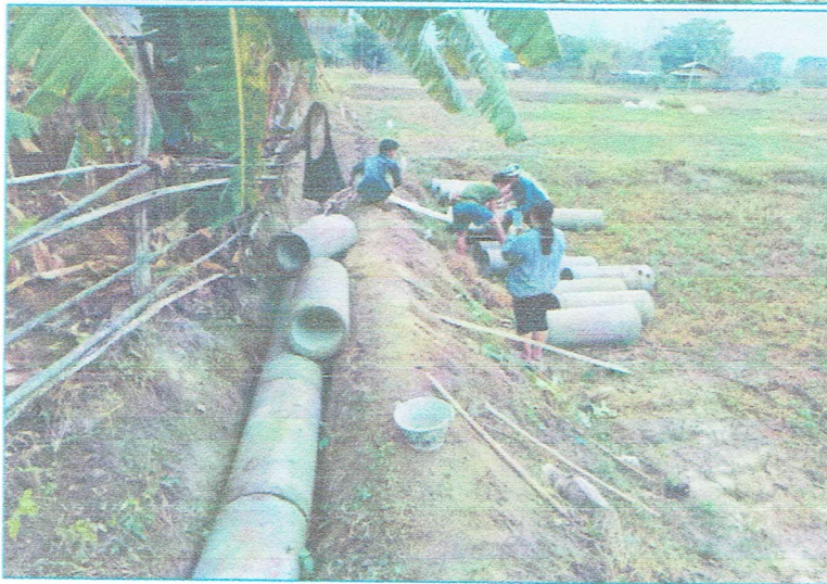
รูปภาพระหว่างการก่อสร้าง

ขอรับรองว่าเป็นรูปภาพตามโครงการดังกล่าวจริง