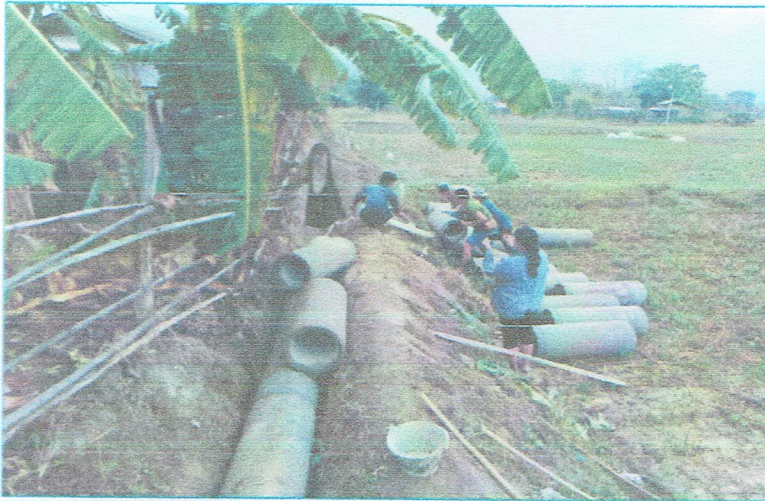
รูปภาพระหว่างการก่อสร้าง

โครงการจัดซื้อวัสดุก่อสร้างท่อระบายน้ำ คสล. โดยใช้แรงงานราษฎรเป็นหลัก บ้านสมัยเหนือ หมู่ที่ 1 วางท่อระบายน้ำ คสล. Ø 0.30 เมตร นอก. ชั้น 3 จำนวน 26 ท่อน โดยใช้แรงงานราษฎรเป็นหลัก