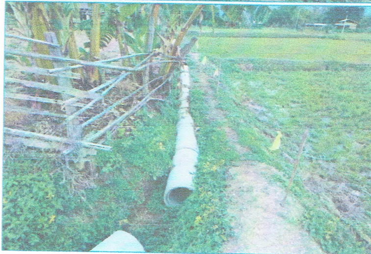
รูปภาพการก่อสร้างแล้วเสร็จ

ขอรับรองว่าเป็นรูปภาพตามโครงการดังกล่าวจริง