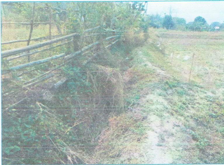
รูปภาพก่อนการก่อสร้าง