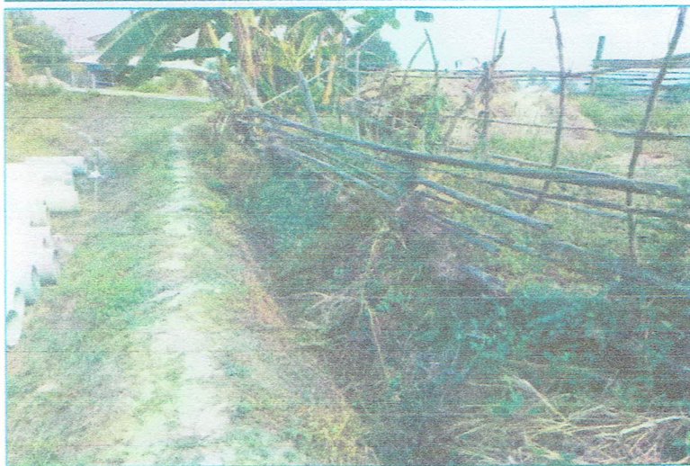
รูปภาพก่อนการก่อสร้าง

ขอรับรองว่าเป็นรูปภาพตามโครงการดังกล่าวจริง