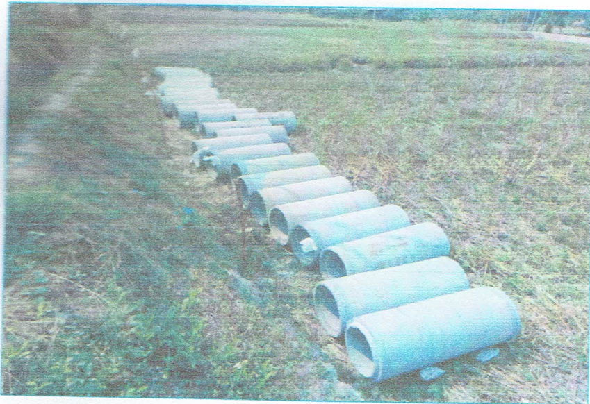
รูปภาพพัสดุ

โครงการจัดซื้อวัสดุก่อสร้างท่อระบายน้ำ กสล. โดยใช้แรงงานราษฎรเป็นหลัก บ้านสมัยเหนือ หมู่ที่ 1 วางท่อระบายน้ำ กสล. Ø 0.30 เมตร นอก. ชั้น 3 จำนวน 26 ท่อน โดยใช้แรงงานราษฎรเป็นหลัก